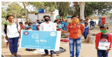
जागरूकता अभियान में शामिल स्वयंसेवक।